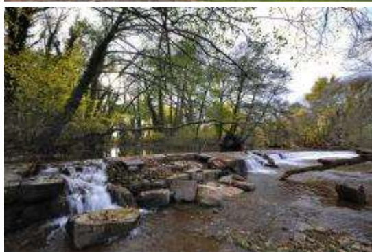
Antiguo aserradero y presa (L'Aille)