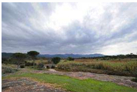
Lugar llamado Puente romano