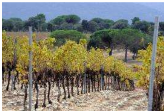
Viñedos cerca de Les Bertrands