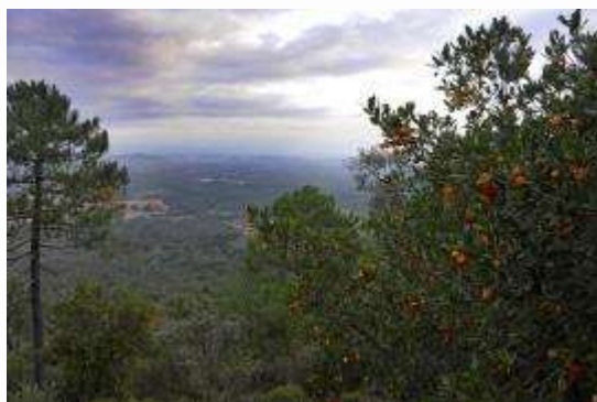
Vista de la llanura y de los pinos